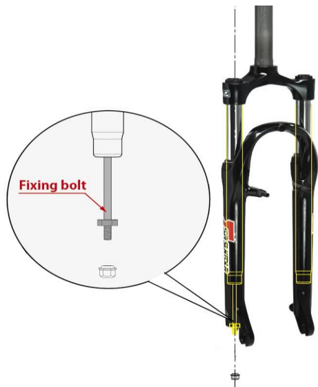
Figure: Multiple fixing bolt version

Fork models: Giant Enchant 1 (SR 前叉型號:M3030) , Giant Enchant 2 (SR 前叉型號:M3010)