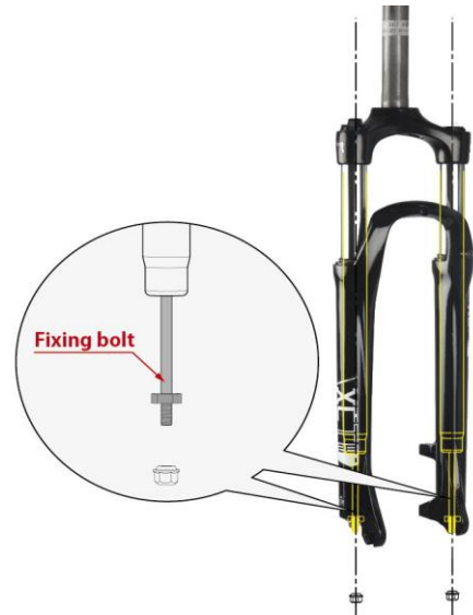
Figure: Multiple fixing bolt version 雙邊固定螺絲版本(right and left sides 右側和左側)